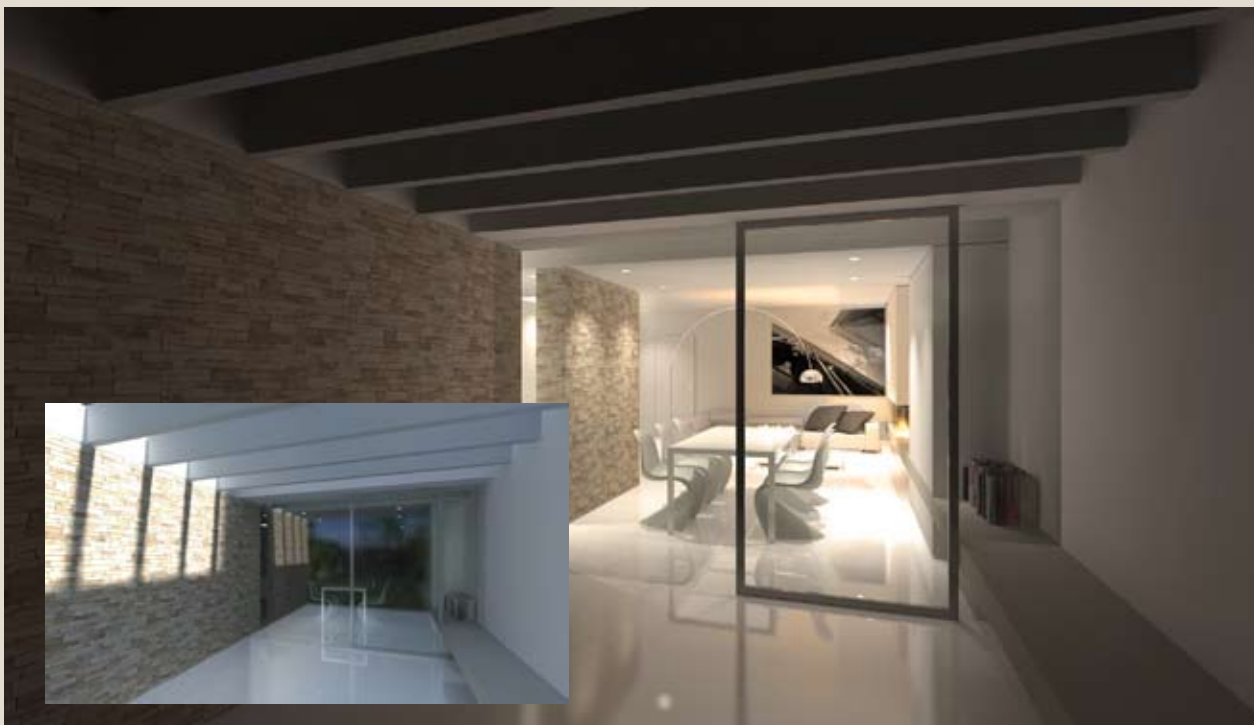
Tweemaal hetzelfde interieur, om 9u30 (inzet) en om 23u